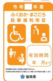
オレンジ色 (妊産婦、けが人)