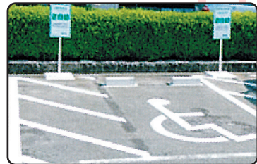
目印ステッカーが掲示してあるスペースで利用できます