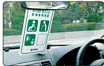
利用証をルームミラーに掛けて使用します