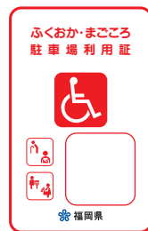
赤色 (車椅子常時利用の身障者で自ら運転)