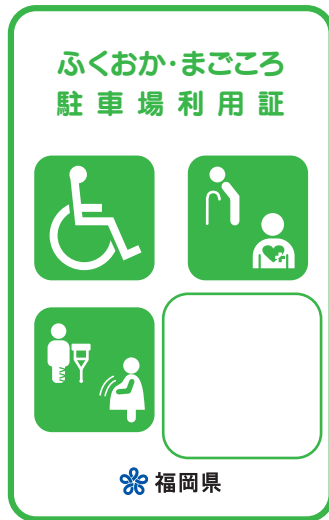
緑色 (身体・知的・精神障がいのある方、高齢者、難病者)

赤色の利用証は、車椅子常時利用の身体障がいのある方で、自ら運転する方に交付しています。幅の広い駐車場が必要な方となりますので、ご配慮をお願いします。